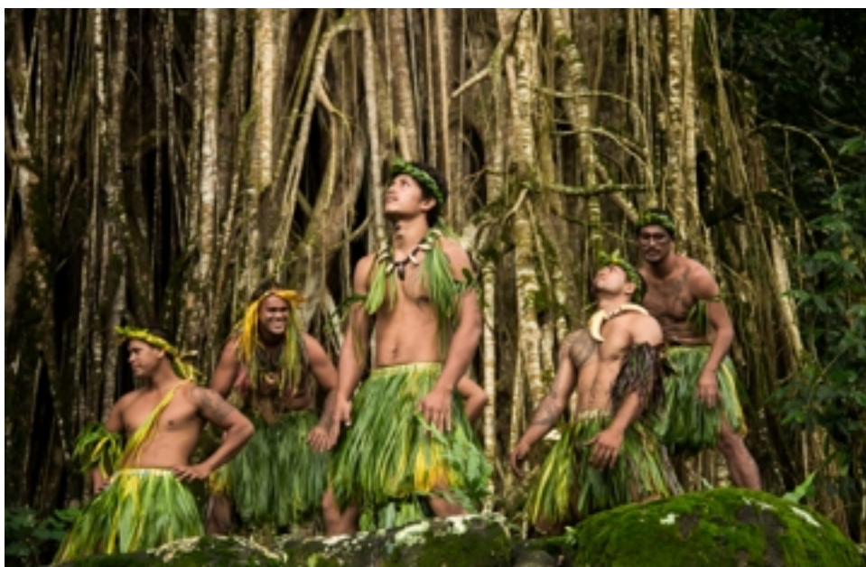
■ Un périple qui permet de rencontrer les populations et de partager leurs traditions et folklore.

Menacées par les activités humaines et les effets du changement climatique, les îles Marquises viennent d'entrer au patrimoine mondial de l'Unesco, pour une meilleure valorisation de ce patrimoine culturel et naturel unique.