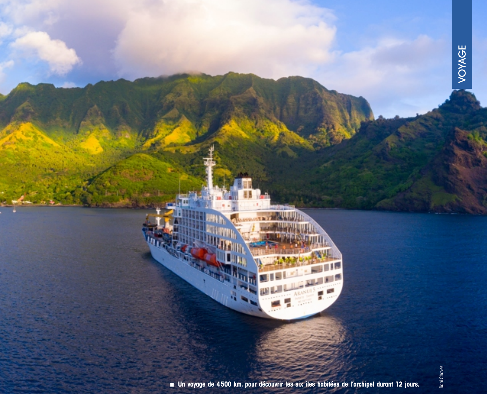
■ Un voyage de 4500 km, pour découvrir les six îles habitées de l'archipel durant 12 jours.