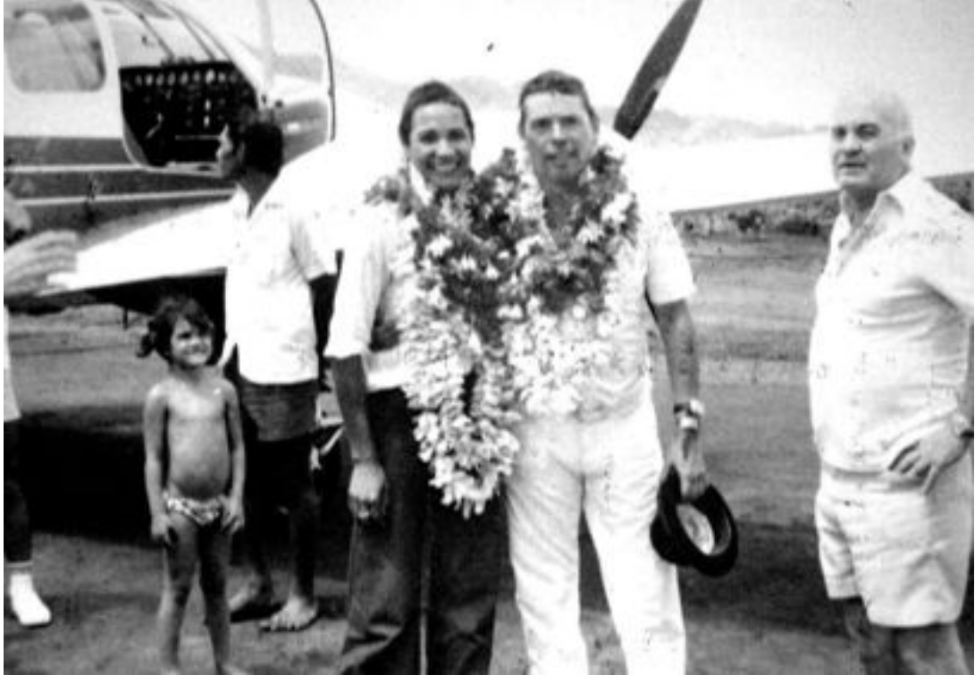
■ Brel s'est fait connaître de la population non pas pour son répertoire, mais pour les services qu'il rendait.

D epuis deux siècles, les Marquises ont attiré de nombreux Occidentaux sur ses rivages. Ces îles ont servi de refuge aux écrivains, aux artistes, aux explorateurs et aux aventuriers, leur apportant l'inspiration et le réconfort loin de la civilisation moderne et de son stress. Le romancier américain Herman Melville et l'écrivain écossais et grand voyageur Robert Louis Stevenson ont ainsi écrit des romans inspirés de leurs expériences dans les îles. Le peintre français Paul Gauguin (1848-1903) a passé les dernières années de sa vie à Hiva Oa où il a peint quelques-uns de ses plus grands chefs-d'œuvre. Enfin, le chanteur belge Jacques Brel y a écrit des chansons de son treizième et dernier album Les Marquises pendant son séjour dans l'archipel. Un coup de projecteur extraordinaire sur ces îles du bout du monde.