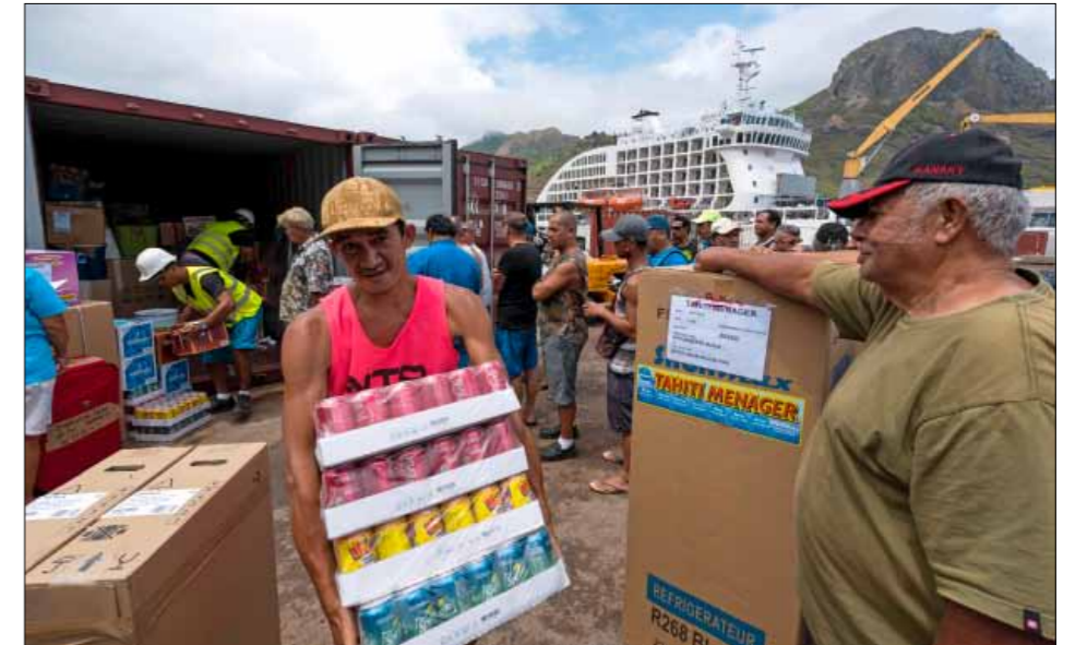
Sur le quai chacun attend sa livraison. Les containers se vident au rythme de l'appel des destinataires des colis.

cales 1 et 2 se poursuit, la cale 3 étant dévolue aux îles d'Hiva Oa et Ua Pou. La cale 4 contient tout ce qui pèse plus de deux tonnes. Pour l'équilibre du navire, qui mesure 126 m sur 22,4 m, on décharge d'abord l'avant. Au contenu des cales s'ajoutent six containers surgelés et six réfrigérés, ainsi qu'un bateau pour la pêche au gros, activité proposée aux passagers à certaines escales.