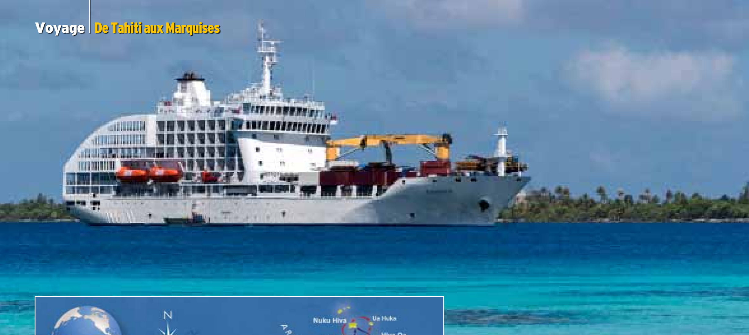
L'Aranui 5 à l'ancre à Fakarava. À l'avant, la partie fret et, à l'arrière, avec sa belle forme arrondie, la partie dévolue à la croisière.