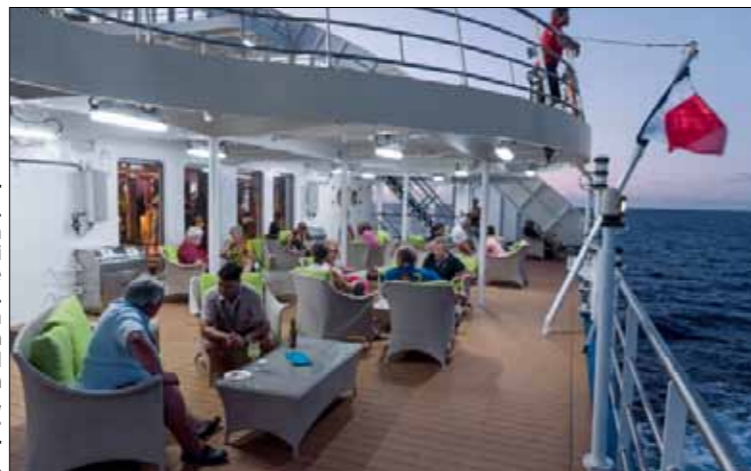
Happy hour à l'arrière. L'ambiance à bord de l'Aranui 5 n'est pas celle de l'Aranui 3. Le bateau a gagné en confort ce qu'il a perdu en convivialité, tant pour l'équipage que pour les passagers.

Hatiheu, dans le four marquisien, cuisent à l'étouffée, sous des feuilles vertes de bananier, du porc, des fruits de l'arbre à pain et des bananes. Poisson cru pour commencer, chèvre au lait de coco, puis ananas, papaye, mangue, pamplemousse, melon, pastèque, la table est bonne «Chez Mamie Yvonne». Nous retrouvons l'Aranui 5, à Taiohae, à quai cette fois. Le déchargement des