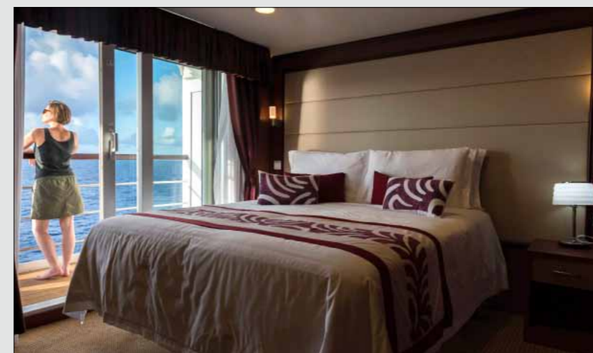
Clairement orienté croisière, l'Aranui 5 compte plusieurs suites. Ici, la chambre de la suite présidentielle, avec balcon sur le Pacifique.

La météo varie beaucoup au cours d'une même journée.