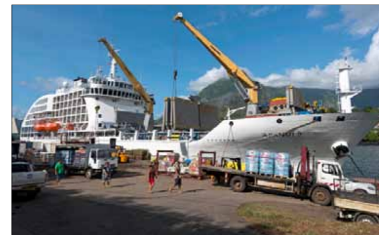
Déchargement à Atuona, sur l'île d'Hiva Oa. C'est une escale importante, l'Aranui transporte environ 400 t de fret par voyage.