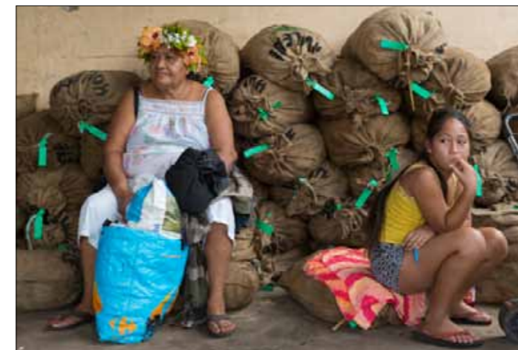
Assises sur des sacs de coprah, deux Marquisiennes attendent d'embarquer à bord de l'Aranui 5, pour aller visiter de la famille sur l'île voisine.