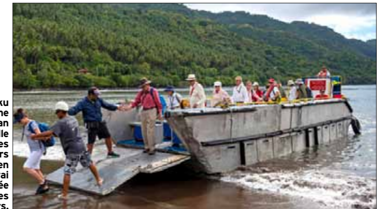
Île de Nuku Hiva, comme dans le roman de Melville («Taïpi»), les passagers débarquent en baie de Taïpivai aussi appelée baie des Contrôleurs.