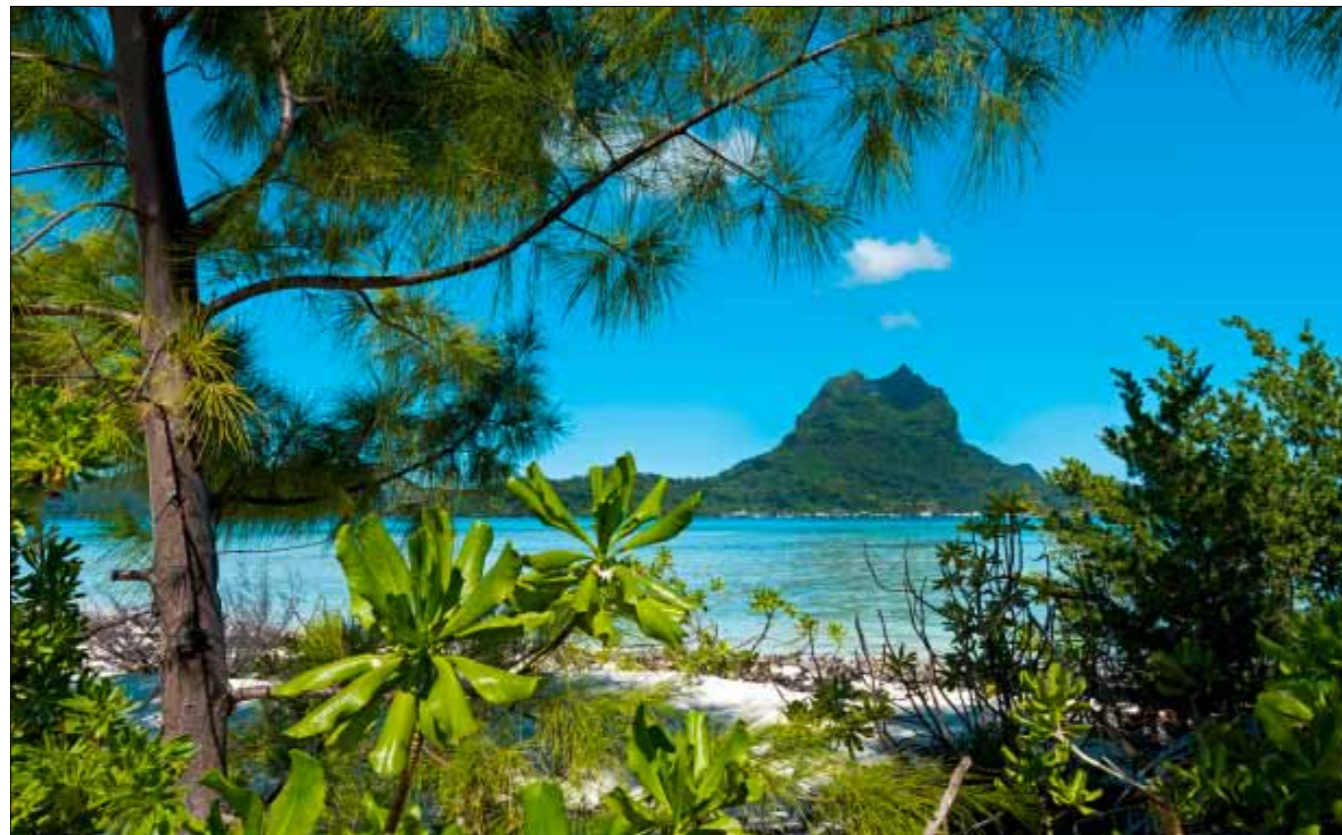
Bora-Bora, c'est l'image du Paradis. L'Aranui 5 ne fait pas de fret ici. C'est une escale purement touristique, avant de regagner Tahiti.