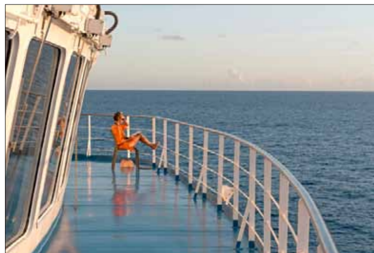
Après sa tournée dans les Marquises et un stop à Rangiroa, l'Aranui 5 amorce la route du retour, cap sur Bora-Bora au soleil couchant.