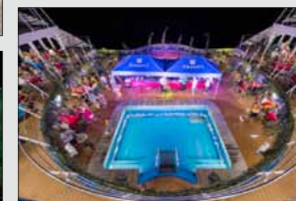
En haut, à g. : Des va'a sur la plage de Ua Pou. Les jeunes sont nombreux à venir s'entraîner à la pirogue polynésienne. En haut, à dr. : La tombe de Jacques Brel sur l'île d'Hiva Oa, dans le petit cimetière d'Atuona. Ci-dessus et ci-contre : Fête et danses polynésiennes sur le pont arrière, autour de la piscine.