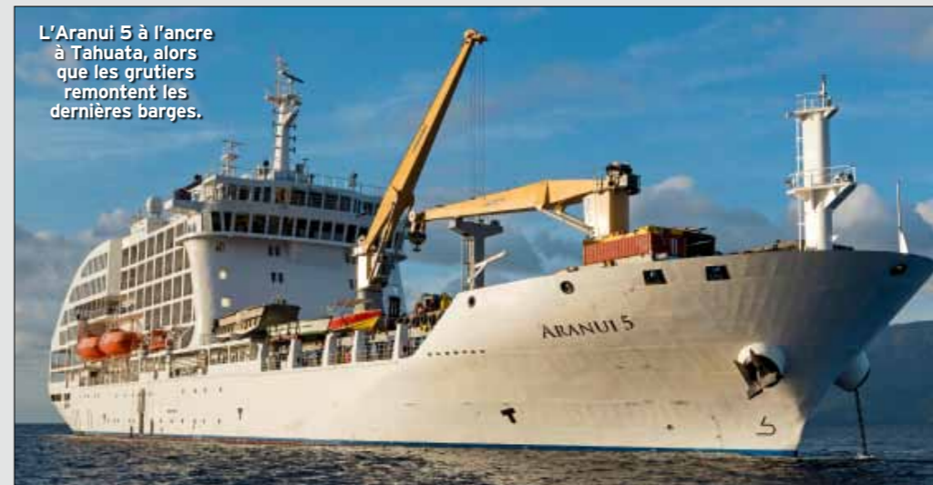
L'Aranui 5 à l'ancre à Tahuata, alors que les grutiers remontent les dernières barges.

Les Marquises sont des îles tropicales humides, il y fait chaud toute l'année. Pendant l'été austral, la saison chaude et humide, de janvier à août, les températures sont élevées. La meilleure période pour y aller est de septembre à décembre, pendant l'hiver austral. Les Marquises sont soumises aux alizés.