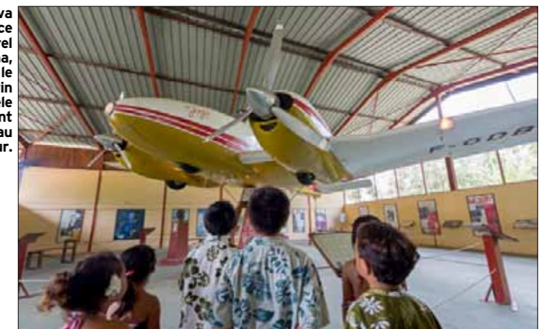
Sur l'île d'Hiva Oa, l'espace Jacques Brel à Atuona, abrite «Jojo», le Beechcraft twin Bonanza modèle D50, ayant appartenu au chanteur.