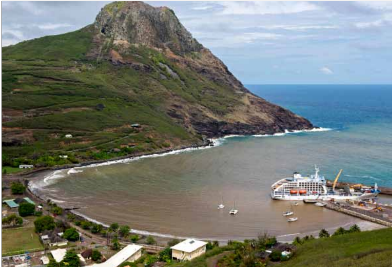
L'Aranui 5, dans l'anse d'Hakahau, sur l'île de Ua Pou. Un nouveau quai y a été construit pour pouvoir l'accueillir.

les croisiéristes, au pied d'un banyan à la conférence étonnante. L'arbre sacré renferme de nombreuses sépultures. Le son des tambours et les cris de la danse du cochon raisonnent dans la forêt. «Kai kai !», «A table !». À